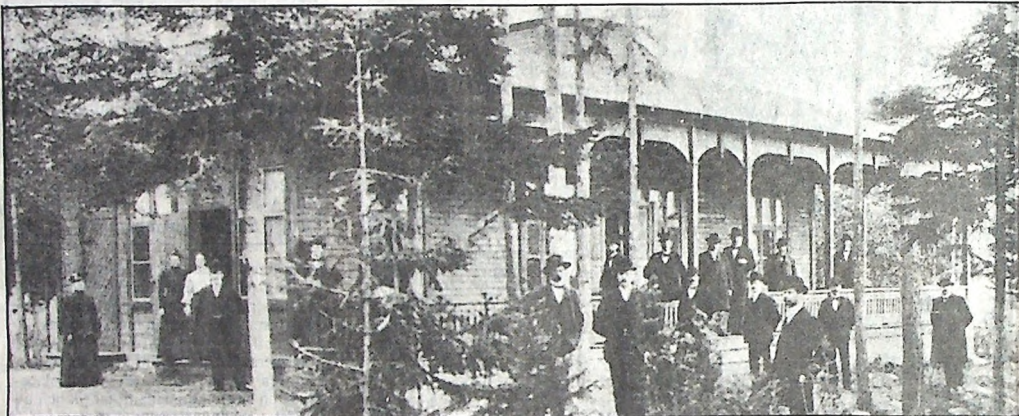
Kroppkärr har också haft egen folkpark. Så här såg där ut året 1905.

VI VAR FATTIGA. MEN – VI VISSTE INTE OM DET