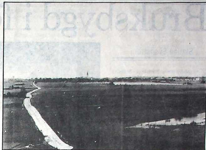
Ruds-vägen-Färjestads-vägen år 1894. I fonden Herrhagens vattentorn — 100-åring i år! — samt Domkyrkan