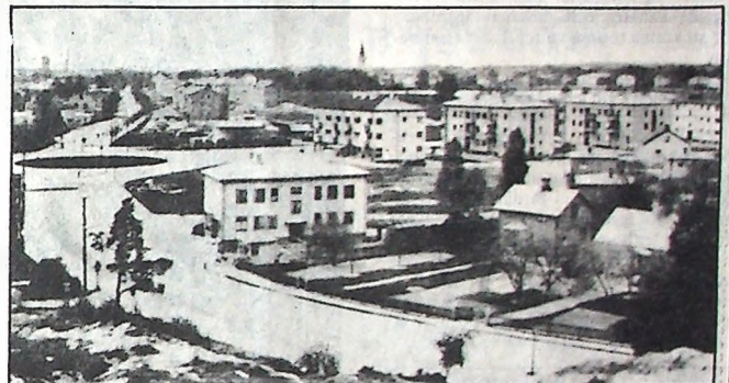
Samma utsikt från Rudsberget som på 1894 års bild, men fotograferad i modern tid, omkring 1950.

runt i staden med diverse gods, under kriget med kol och koks.