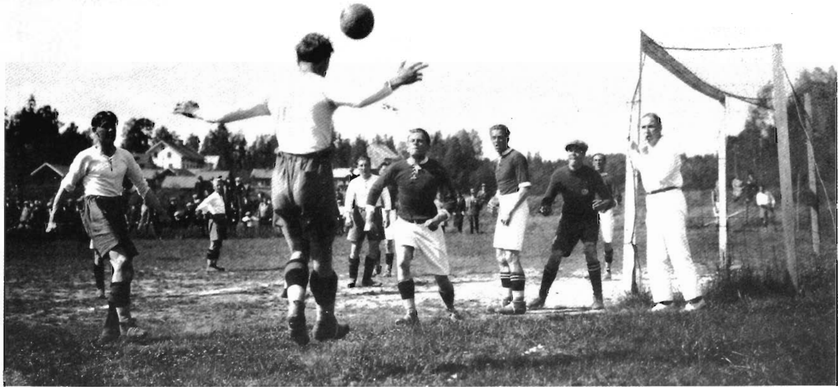
IF Nyedshov 70-års jubilerar. Under året firar föreningen IF Nyedshov / Lindfors 70 - årsjubileum. Föreningen bildades 1928 med fotboll och ishockey som aktiviteter, en tid hade man även skidor på programmet. I dag bedriver Nyedshov/Lindfors verksamhet både inom fotboll och ishockey med ungdoms- och seniorspel där ett 150-tal aktiva deltar. Jubileet kommer att firas under hela året med ett flertal aktiviteter, bland annat kommer en Fotbollens Dag att arrangeras. Bilden visar en match på Åsvallen, årtalet är 1931.