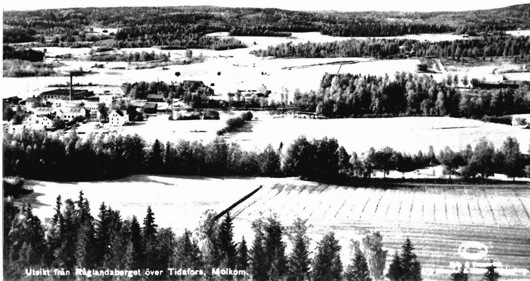
Utsikt från Råglandaberget över Tidafors, Molkom.

Gott Nytt År önskar hembygdsföreningen och företagen i Molkom