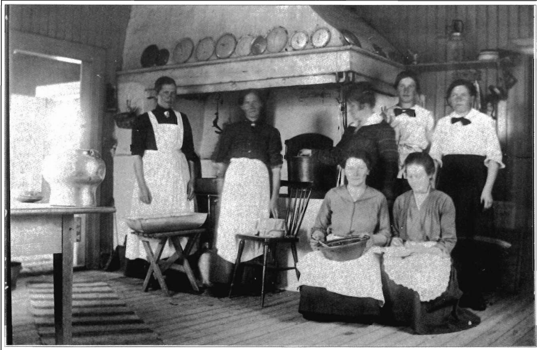
Hantverk och kultur Det finns mycket hantverk i bygden. Keramik, vävda alster, näverslöjd, ting av trä, tillverkning av dockor, knivar, tittskåp, akvarellmålning med mera växer fram ur duktiga hantverkarens händer. Föreningen Handkraft är ett exempel på en livaktig förening med ett 20-tal medlemmar som har egen försäljningslokal. Föreningen firade under föregående 15 år. Kulturen vurmar Hembygdsföreningen och Studieförbundet Vuxenskolan för. De arrangerar bland annat visning, temadagar och utbildning i olika slags hantverk. Nämnas kan göras att studieförbundet under förra året hade 30 - års jubileum medan hembygdsföreningen kommande år firar jämna år. Foto taget 1918 och visar prästgårdens kök, där man arbetar med ystning.