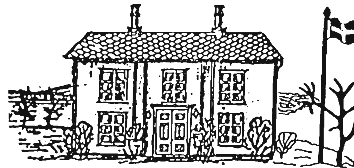
Hembygdsgården i Upprud.

Föreningen tackar dessutom ortens företag som gör det möjligt att till hela bygden kunna förmedla denna almanacka.