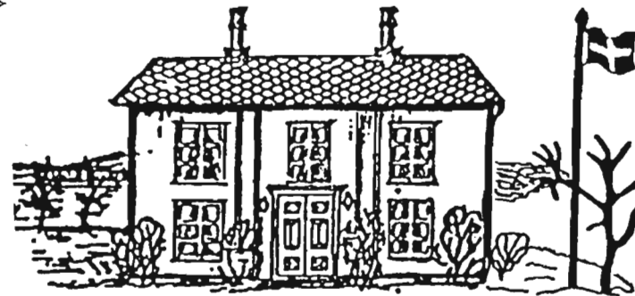
Hembygdsgården i Upperud.