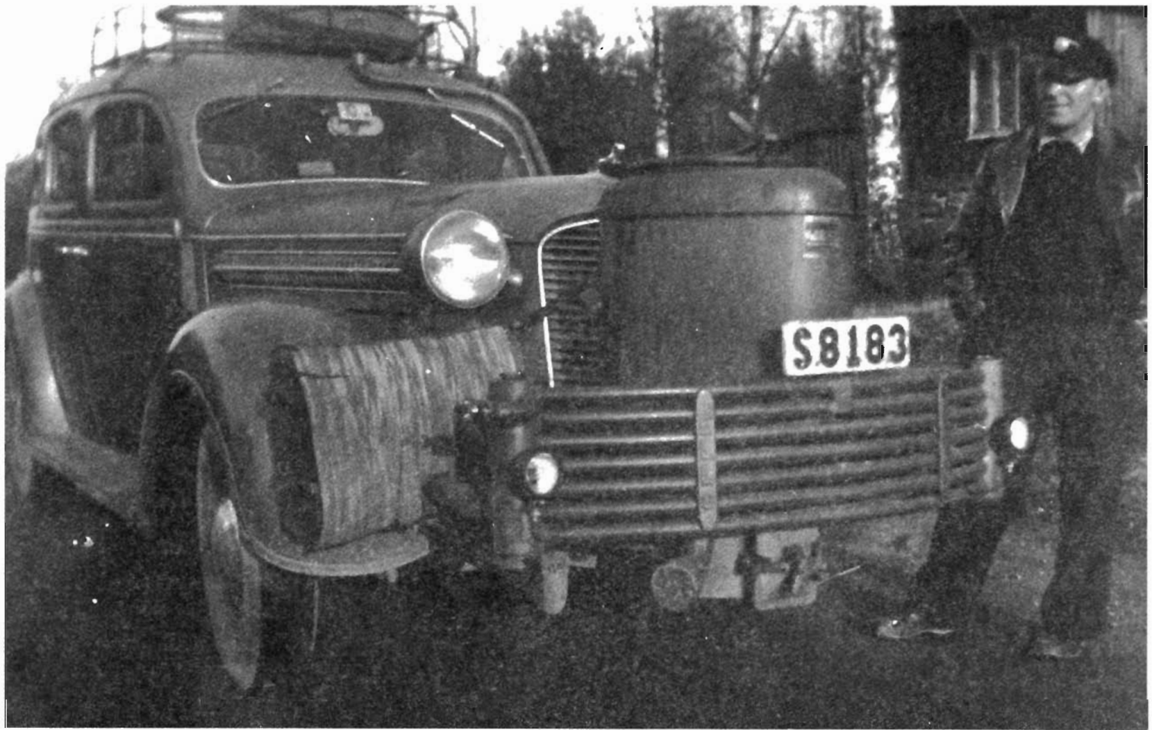
Taxi med gengas. Under krigsåren -40 - 45 fanns inte bensin tillgå, alternativet var gengasaggregat som sattes på bilarna. De eldades med kol eller björkved som sågades i små klossar. Chauffören tände eld på morgonen och fick ordentligt fyr med hjälp av en fläkt. Aggregatet behövdes fyllas på med jämna mellanrum, säckar med bränsle sågs och transporterades ofta på takräcket. Taxichauffören på bilden är Birger Karlsson, Bergstorp, Norum - årtal 1942.